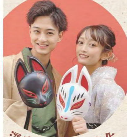
深度體驗日本文化